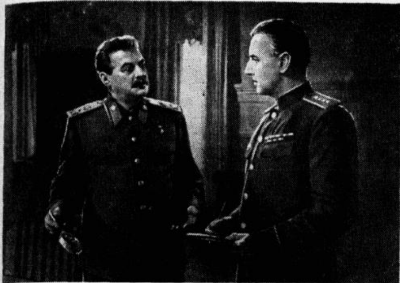
Kadrs no filmas «Trešais trieciens»