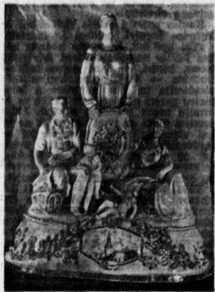
A. Brzezička skulpturālā grupa «Dzimtene» («Oktobra 30 gadi»)

Pirmā Maija svētku dienās LPSR Valsts Rietumeiropas mākslas muzejā atklāta Krievu pirmsrevolūcijas un padomju laika porcelāna izstāde