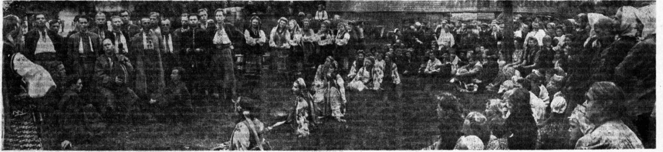
Viesdamies kolchozā «Čiņa», Zaņkoveckas vārdā nosauktā L'vovas ukraiņu teātra mākslinieki sniedza mākslinieciskus priekšnesumus. Attēlā: aina no lugas «Nazars Stodoļa»