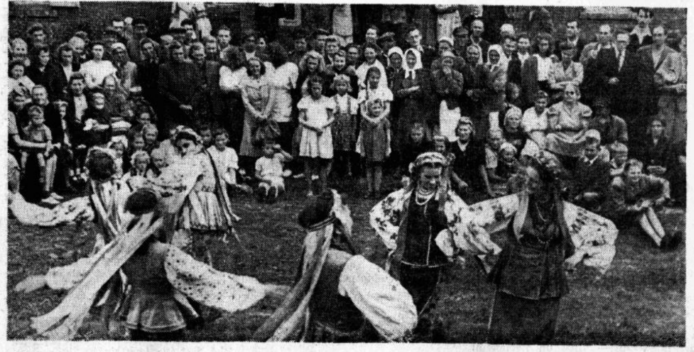
Zaņkoveckas vārda nosauktā L'vovas teātra mākslinieki viesojas Dreilīņu pagasta kolchozā «Čiņa»