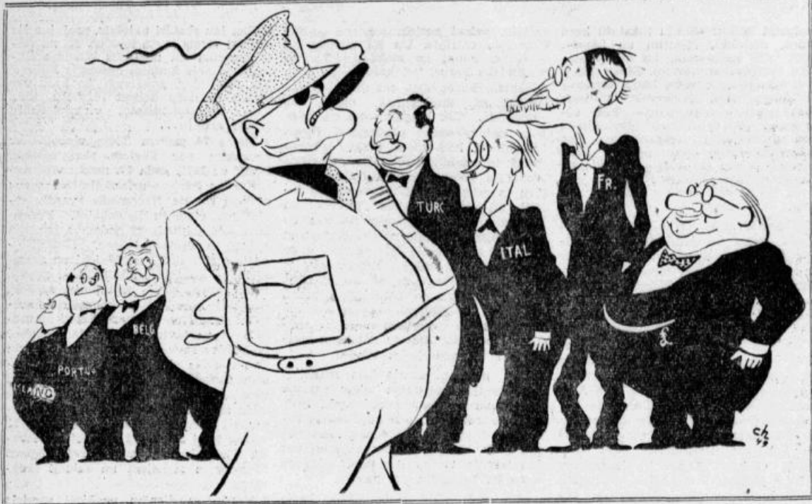
... GENERALI BEZ ARMIJAS