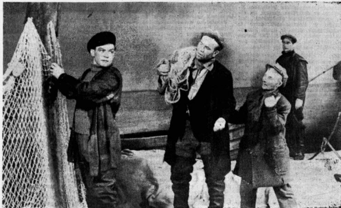
Savim 30 gadu darba svētkiem LPSR Valsts Dramas teātris gatavo tautas rakstnieka Viļa Lāča «Zvejnieka dēla» uzvedumu. Attēlā: skats no jaunā inscenējuma, kura pirmizrāde notiks 27. martā.

Mūsu šigada budžets ir pieņemts PSRS Augstākās Padomes sesijā. Kā Likums tas stāties spēkā, lai Stalina pēckara piegādes celtniecības programmu pārvērstu par īstenību. Mēs, padomju laudis, nešaubāmie, ka šī īstenība nāks, nāks brīnšķīga un krāšņa. Tam garantija ir padomju cilvēka darbs, tam garantija ir Partija, tam garantija ir lielākais cilvēks mūsu dienās — Stalins!