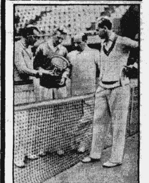
Londonā notika profesionālo tenisistu turnīrs, kur uzvarēja amerikānis Donalds Budge. Uzņēmumā no kreisās redzam profi slavenbu izlasi: Tildenu, Budgi, Nissleinu un Vainesu.

Savā laikā jau ziņojām, ka Holande atteicās noturēt iepriekš nolikto futbola valsts saciksti ar Vāciju. Iemesli toreiz bija tīri politiska rakstura. Tagad no Amsterdamas ziņo, ka holandieši paši piedāvājuši vāciešiem šo atlīkto spēli noturēt. Vācijas atbilde vēl nav zināma.