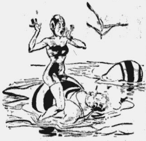
„Es taču domāju, ka tā ir mana gumijas bumba!”

Guibis (LV) 5,55; 11. Pālēns (O. RAPSĶ) 5,33.