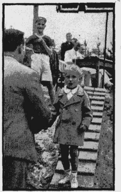
Kad lielajā skatītāju pūlī tenisa sacīkstēs dēļens atrod pazudušo tēvu...

ABONĒŠANAS MAKSA: Ar piešķiršanu Rīgā un visā Latvijā: 1 mēn. La 1,30; 3 mēn. La 3,00; 6 mēn. La 6,50, 1 gads La 12,50. Abonēšanas maksa Igaunijā un Lietuvā: 1 mēn. La 1,25; 3 mēn. La 3,40; 6 mēn. La 6,75; 1 gads 12,75. Uz visām ārzemju valstīm Eiropā un ārpus Eiropas veltējā abonēšanas maksa 100% dārgāki. Abonementu izsūtīs no 1. un 15. dat. Tekošs rēķins postā Nr. 11023.