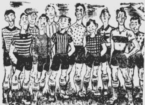
Vienība, kas aizmirsusi sarunāties par apģērba krāsām.