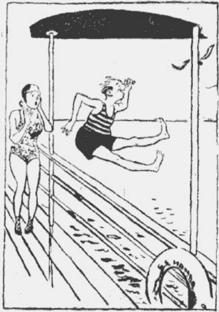
Ko tu dari? Tas taču nav baselns peldēšana!