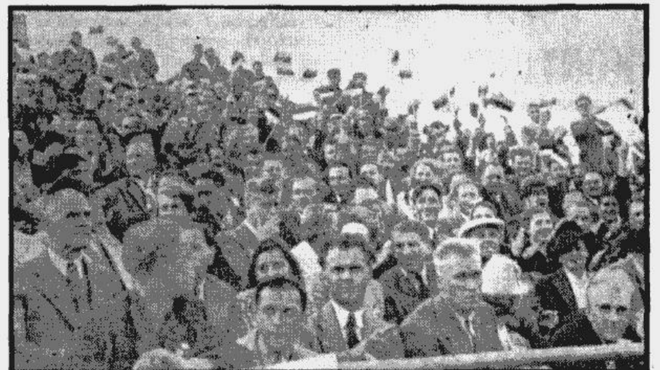
Jūsmīgi (kā to redzam uzņēmumā) savas vienības panākumus, nacionālos karodziņus vietnot, sveica daudzle Igaunijas ekskursanti.