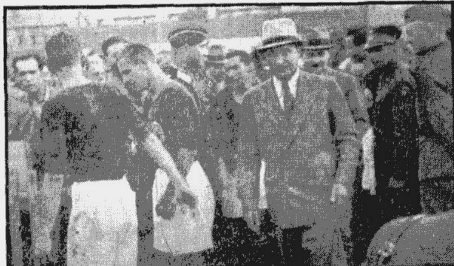
Valsts sporta vadītājs — sabiedrisko lietu ministrs A. Bērziņš ierodas pie mūsu spēlētājiem Igaunijas—Latvijas valstu sacikstes starptautā.

Lauks un Laumanis — abi mūsu aizsargi kļūst dienu dienu vecāki. Pēteram Laukam (Beigas 2. lp. pusē).