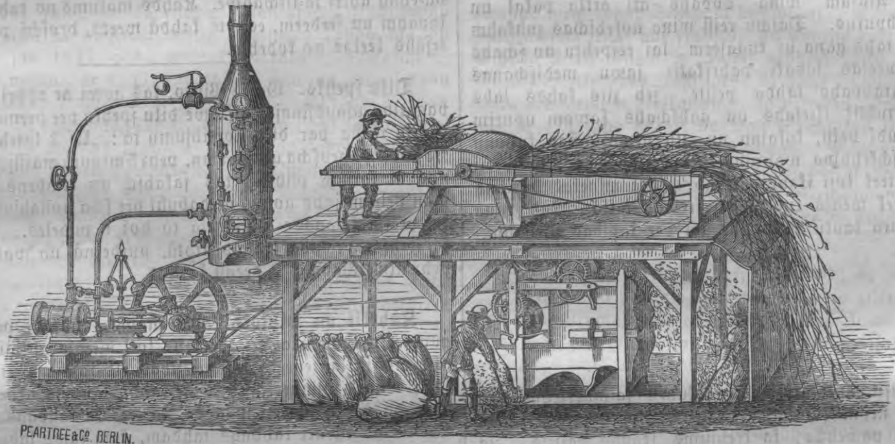
PEARTREE & CO. BERLIN.