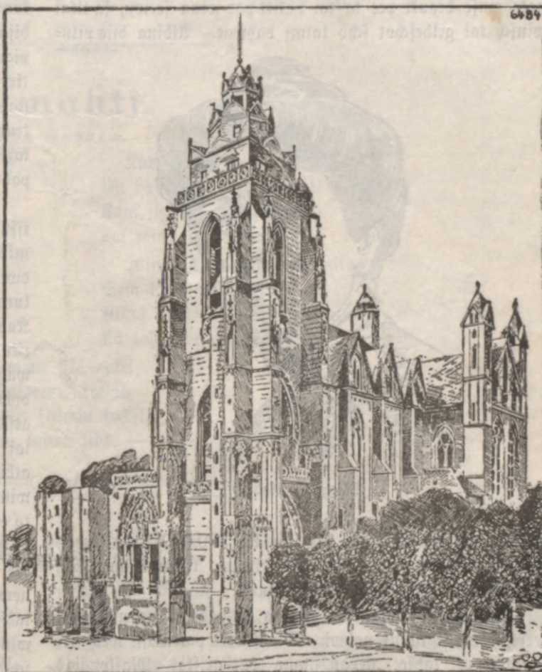
Wezlaras domas bāniza.