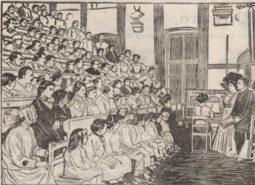
Konzerts Berlins Charitē-ſtimnizā.