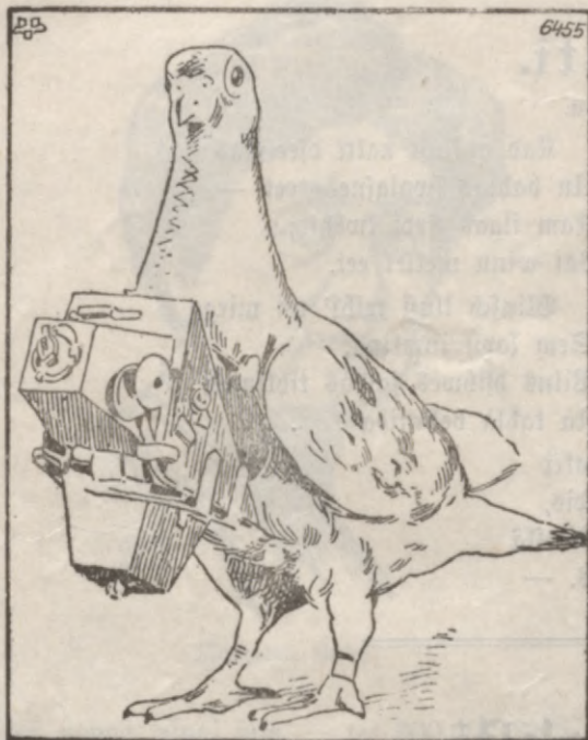
Wehtuku balodis ar fotografejamo aparatu.

Leelisks dabas brihnumš. Nā tahdu „G l o b u s“ aptehlo Guayra uhdens kritumu, kuresch ar sawu