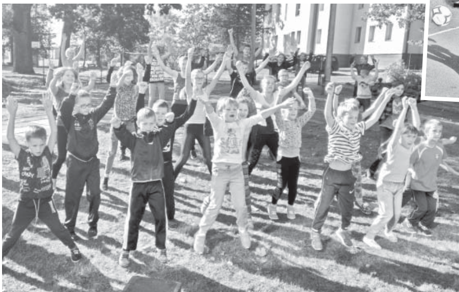
Visi kopā izpildām Olimpiskās dienas vingrojumu kompleksu.