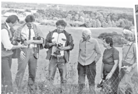
Vēsturiskā fotogrāfu tikšanās reize Kņāvu pilskalnā, 13.08.1986.