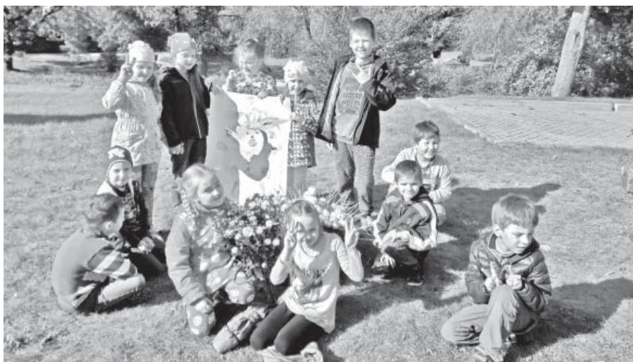
Miķeļdienas pasākums Viesītē. Aktivākie bija 1. b klases skolēni, audzinātāja un vecāki.

7. oktobrī mazpulcēni devās uz Salaspili, uz Nacionālo Botānisko dārzu un 2. vidusskolu, lai mērotos spēkiem ar citiem Zemgales, Latgales un Vidzemes jaunie-