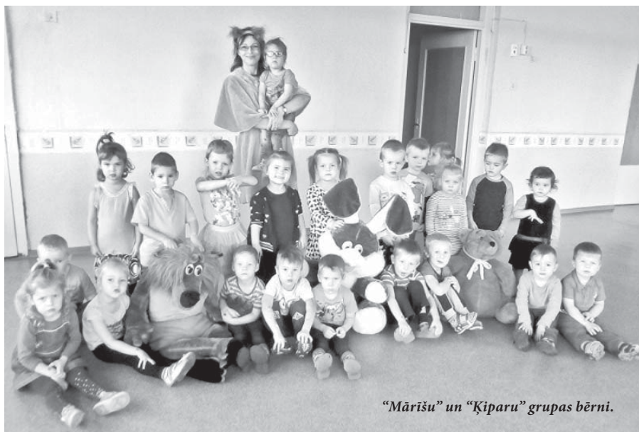
"Mārišu" un "Ķiparu" grupas bērni.

Kad daba ir tērpusies košākajās drānās un rudens vējš savas stabules pūš, PII "Zilīte" 18. un 19. oktobrī nejausi iemaldījusies vāvere Kuplaste, kura visus aicināja jautrās rotaļās un stafetēs. Meklējot atpakaļceļu uz mežu jautras mūzikas pavadībā, Kuplaste kopā ar bērniem satika zaķi Īšļipi, lāci Brūni, vilku Pelēci un ezīti Adatiņu. Visiem kopā bija jautri, jo tika lēkts ar maisiem zaķa cepurēm galvā, sniegta palīdzība lācim, saņemot medus podus. Palīdzīga roka netika liegta arī ezītim, sašķirojot ābolu ražu, bet vilkam bērni palīdzēja noņemt aitiņas.