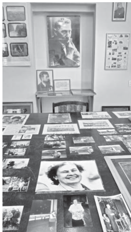
Stāsts par rakstnieci Fotogrāfijas kabinetā.