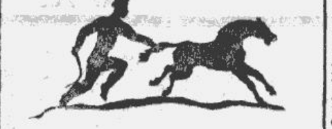
Ass skrējēja treniņš.