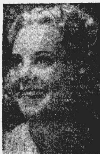
Miljonārs Soņa Henni.

un draugi pat dabūja samaksāt viņa apbedīšanas izdevumus. Ir tikai nedaudz sportistu, kas savus saņemtos miljonus arī tiešām pratuši pienācīgi novērtēt un sataupīt. Tie ir daži izņēmumi. Ar cīnību te pieminams bijušā pasaules smagā svara boksa meistars Džena Tenneja vārds. Šis vīrs, kas atstāja ringu neuzvarēts, kļuvis pat vēl vairāk nekā miljonārs un šodien Džens Tennejs ir kādas lielas bankas prezidents. Arī Maksis Bērs vienā gadā sev saņēma tik daudz naudas, lai dzīvotu bez bēdām vēl tagad. Ja sportā nepelna miljonus, tad tas vēl nebūt negarantē kļūt jau miljonāra godā. Tas izdodas tikai dažiem Dieva miluļiem un tiem, kas izkarājuši sev labu vārdu pie šo Dieva miluļu radītājiem, par kādiem Amerikā uzskata skatītājus, sacīkšu apmeklētājus. Piemēro pēc te var pieminēt, ka 1937. gadā Amerikā vieglatlētikas sacīkstes apmeklēja divi miljoni cilvēku, boksa cīņas — divdesmit miljoni, bet bezbola sacensības pat četrdesmit miljonu skatītāju! Tāpēc arī nav brīnums, ka amerikāņu visu laiku ievērojamākais bezbolists Babe Ruths ilgāku laiku gadā pelnīja 12.500.000 (divpadsmit miljoni piecdesmit tūkstoši) latu! Lielākos ienākumus, kas pat Amerikas apstākļos izklausas sensacionāli, savā laikā deva