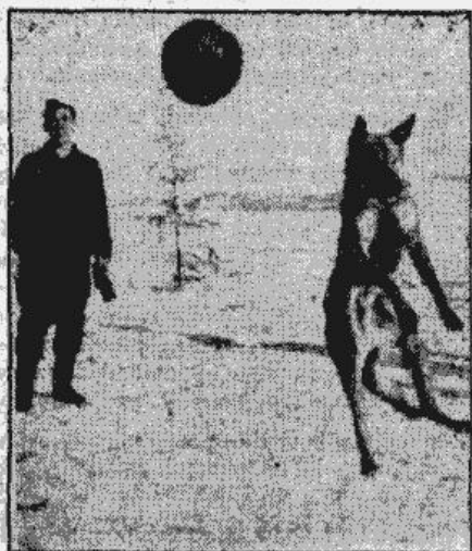
Rietumu frontē karavīru ģimlotākā izklaides nāns ir sporta nodarbības. Uzņēmumā redzam vācu karavīru, kas Zikfrīda līnijas aizmugurē „spēlē futbolu” kopā ar savu uztiģo frontes draugu Džefu.

trīspācītu sacīkstēs boksa LAS sarīkojumā notiks 30. martā Valmierā.