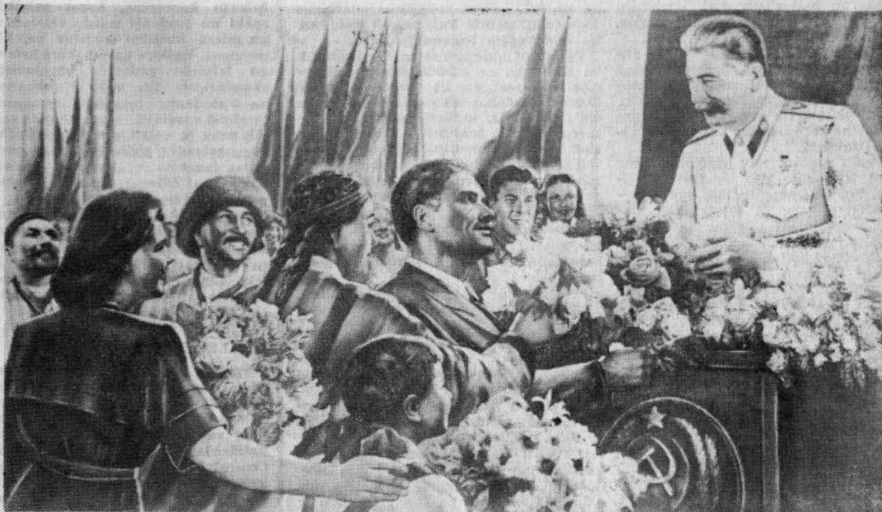
Lielais Staļins — PSRS tautu draudzības karogs