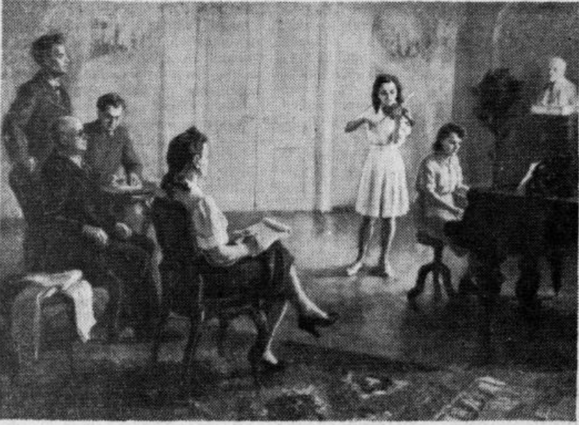
L. Priedes gleznas «Jaunie talanti» reprodukcija