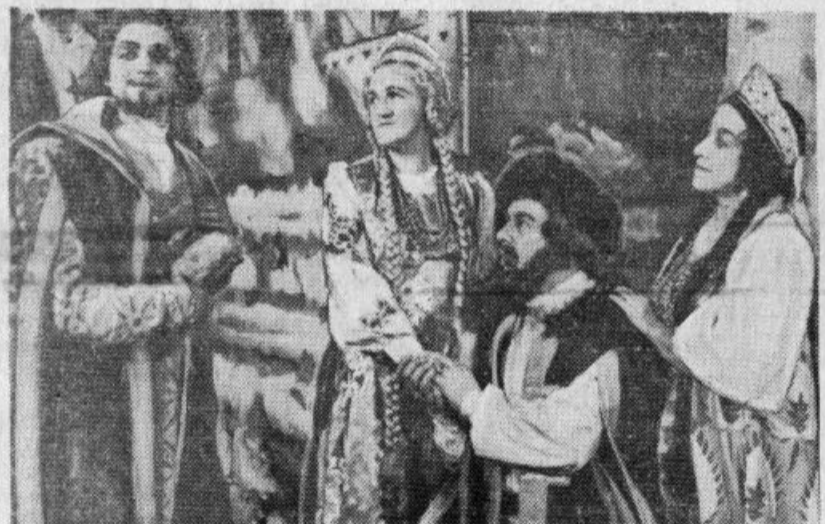
Skats no N. Rimski-Korsakova operas «Čara līgava» iestudējuma Operas un baleta teatrī