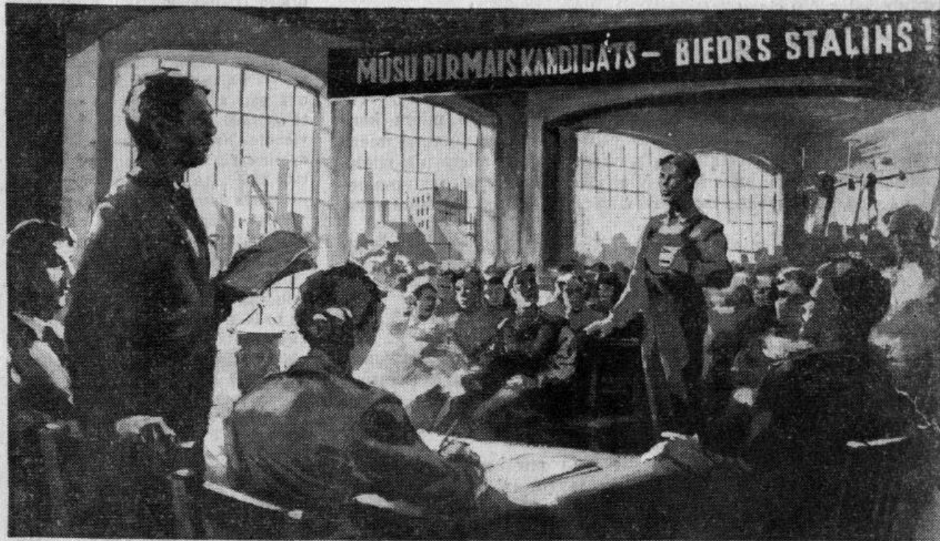
Deputātu kandidātu izvirzīšana rūpnīcā