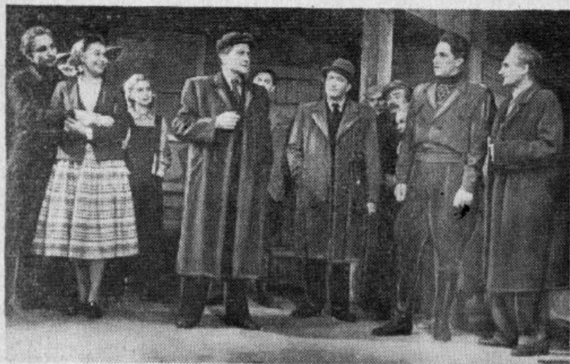
Skats no E. Zālītes lugas «Spēka avots» inscenējuma Dailes teatrī