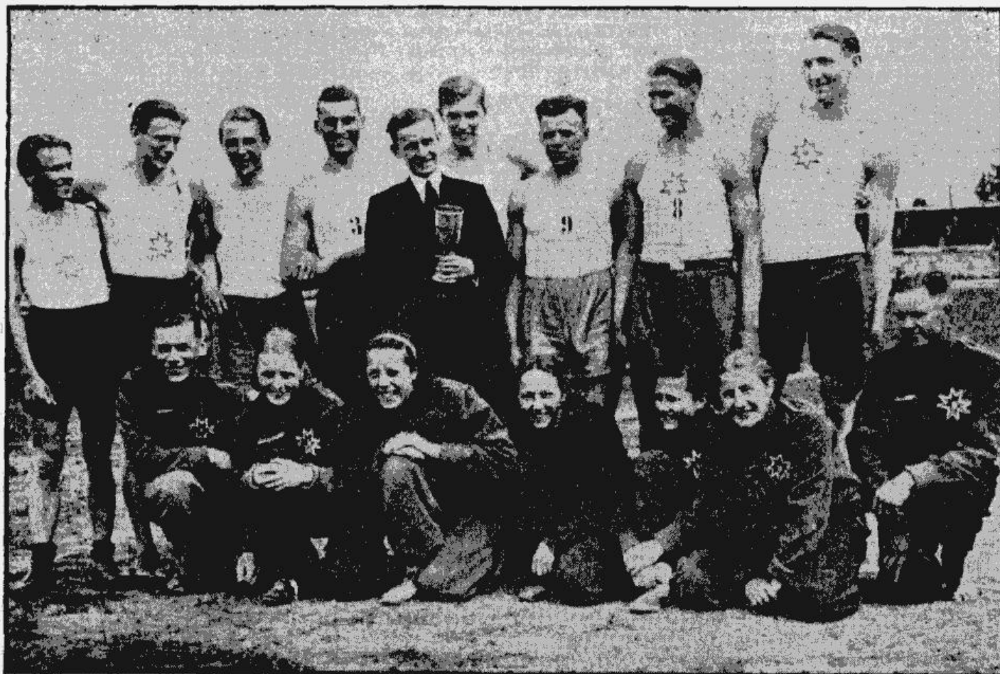
Valmierai aug tiešām slavējami jauni vieglatlēti. Ka tas tiešām tā, visspilgtāk pierādījās vakar LVS rīkotajās iesācēju vienību sacīkstēs desmitcīņā un sievietēm piecīņā. Spožākos panākumus tur guva 8. Valmieras APSK zēni un meitenes, kurus smaidošus, prieka pilnus pēc sekmīgajām vakardienas cīņām redzam augšējā uzņēmumā. Vidū ar balvu stāv 8. VAPSK fiziskā audz. vad. Freimanis. Pirmā rindā no labās pirmās ir jaunais daudzsoļotāis vieglatlēts ģimīs, kas ar savu skrējiena 1500 m distancē vakar skaisīti pārsteidza rīdziniekus.

Vakar pirmo reizi LVS izveda sievietes — iesācēju vienību sacīkstēs piecīņā, piedaloties US 2. vien. un 8. APSK vieglatlētēm. Jānau, kādēļ nepiedalījās LSB, 5. RAPSK un LV vieglatlētē? Iesācēju vienību sacīkstēs desmitcīņā startēja 5 vienības: 8. VAPSK, US, Ziemeļblāzma un LSB 2. vienības. Ar ko izskaidrojams mūsu lielo sporta biedrību: 5. RAPSK, ASK, LAS un DzAPSK nepiedalīšanās? Vai minētām biedrībām trūkst rezervju? Negribētos tomēr tam ticēt. Jau trešo gadu pēc kārtas iesācēju vienību sacīkstēs desmitcīņā uzvarēja 8. VAPSK vieglatlēti. Ar vakardienas panākumu 8. VAPSK savā bilancē jau ierakstījis 4 uzvaras un pilnīgi nodrošinājās īpašuma tiesības uz LVS dāvēto ceļojuma kausu. Valmieras aizsargi vadību uzņēmās jau pašā sākumā un gala iznākumā 8. VAPSK no otrās vietas iepērmēja LSB šķēpa vairāk kā 800 punktu starpība. Valmieriešu šogad sasniegtā punktu kopsūma — 5338, pārspēj arī iepriekšējo gadu punktu summas. Vislielākā atzīmība veiktā 8. VAPSK vieglatlētikas sekcijas vadībai ar teicami sagatavotiem jaunajiem atletiem. Otro vietu ar 5011 punktiem izcīnīja LSB 1. vienība. LSB iesācēju sniegums būtu daudz augstvērtīgāks, ja nebūtu iztrūkusi četri labākie spēļi. Šķiet, ja LSB vienība startētu savā labākā sastāvā, tad cīņa starp 8. APSK un LSB būtu daudz sīvāka. Veselu klasi vājāku punktu kopsūmu atzīmēja US un pirmo reizi startējošie Ziemeļ-