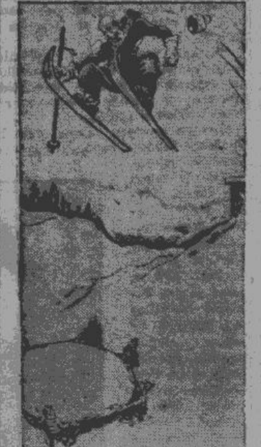
Tā viņš mācas lēkt ar slēpēm...

Jaunā latviešu sporta biedrības Daugavieši sportisti Ziemas svētku izlīti dibinājis 26. decembrī pulkst. 18 biedrības mītnē Carl Schirren ielā 28.