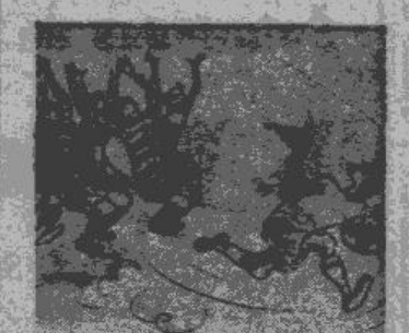
Labākais reģija spēlētājs Amerikā

Pilsētu sacīkstē galda tenīsi vakar Vīnē uzvarēja Prosbarg ar pārliecinošu 5—0 rezultātu. Vīnes sastāva bija Eckl, Solod, Bednar un Wunsch.