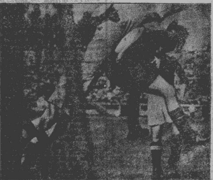
Vīnes no Vīnes Vīnāns visvairāk apbrīnotā spēlētājiem ir vācietis Ploz's — lielākais šķērslis Schalke 04 uzbrucējiem, lai viņu vienība tiktu Vācijas meistara godā. Uzņemuma: vīnietis Ploz's lieliski izcīnīja atvairu pretiniekā uzbrukumā.

5. jūlijā noskaidrosies Vācijas 1932. gada futbola meistars