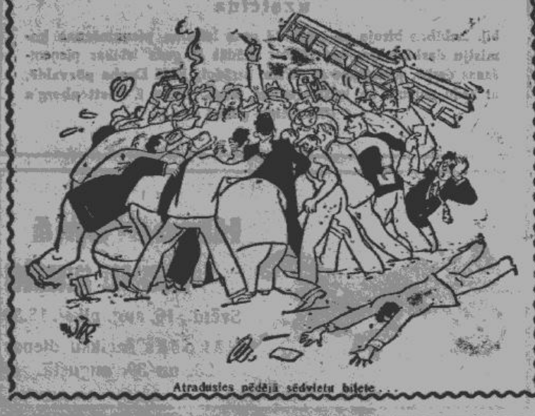
Atradusies pēdējā sēdvietu bilete