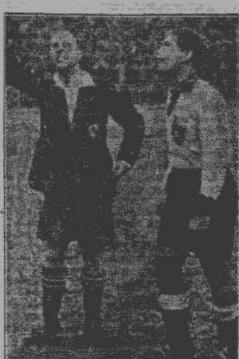
Paul'a Janes'a svarīgā momentā — laukumā izlozē pirmo kādas leģendārās valsts sacīkstēs.

Viens no visievērojamākām un slavas laurim visvairāk apmērītiem vīriem, kāds vien leikā redzēts Eiropas futbola laukumos, acspretimāri ir tagadējais Vācijas valsts vienības kapteinis Paul'a Janes's. Darbojoties savā iemīļotā aizsarga postenā, Janes's ir ne tikai nesavienams aizsardzības ietilksas Helmeistars, bet viņa vārds allaž atrodams arī vārta guvēju sarakstā. Janes's uz priekšu vienmēr dodas tad, kad jāizpilda soda sitiens, ko pretinieks izpelnījies pie 16 m līnijās, tāda attālumā, ka šis raidījums tieši apdraud vārtus. Aizsardzībai tad patīga stieidzas arī uzbrūcēji, lai veidotu «mūri», kuram caur nespētu izlauzties bīstamais šāviens. Janes's tomēr savu sistēmu izkopa tik tehniski pareizu un precīzu, ka pat ciešā «mūra» sienā viņš atrod robu, kur nekā vairs nespēj aizkavēt bumbu lidojumu tieši. Ar šo savu lielāko soda sistēmu speciālisti Janes's izšķēris Vācijas vienpadsmita uzvaru pat vairākās svarīgās valsts sacīkstēs.