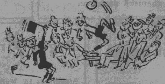
Bomba taču vēl nav ārpus laukuma - domā Liepājas «objektīvais» skatītājs...

Valmieras laikraksts «Tālvietī» savā 29. septembra numurā ievietojis skaistu uzņēmumu no Vācijas-Zviedrijas valstu sacikstes futbola, kas dots kāds paraksts: «Tā ieguva pirmos vārtus zviedru Eli's, kas starptautiskā sacikstē guva uzvaru pār vācu nacionālistiem ar 3-2 (2-2)». Patiesībā paraksts laikam domāts šāds: «Tā ieguva pirmos vārtus zviedru vienpadsmitis, kas starptautiskās sacikstēs guva uzvaru pār vācu nacionālo vienību ar 3-2 (2-2)». Klūdīties ir cilvēci. Tas notiek arī mūsā valstībā - žurnālistikā. Sīr.