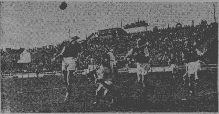
Mūsu acu priekšā paveras brīnišķīga aina no vakardienas lielās spēles, kur ASK un VEF izmēta kaušonus Rīgas meistartitula dēļ futbolā. Aizmugurē skatāms plašais lauku pulks, kas šoreiz dabūja pietiekami skumt un arī priecāties.