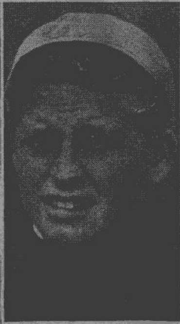
Tā ir viņa...