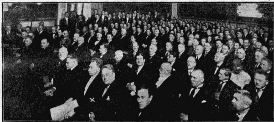
Gada svētku akts aulā.