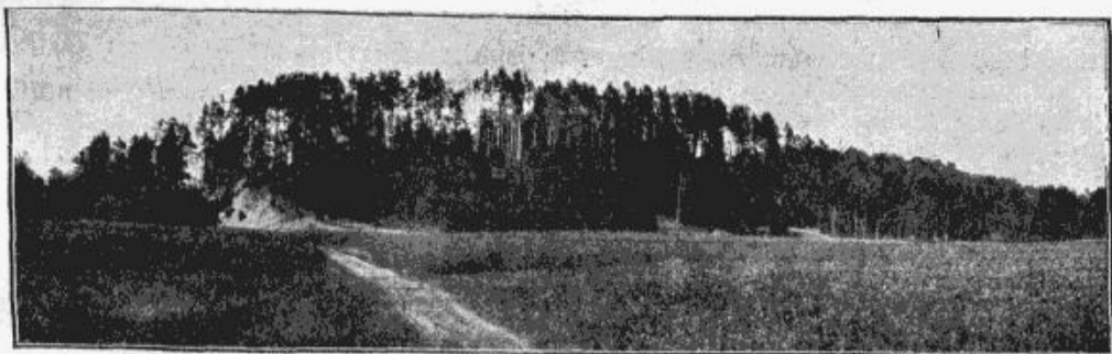
Latgales āres rudens noskaņš.