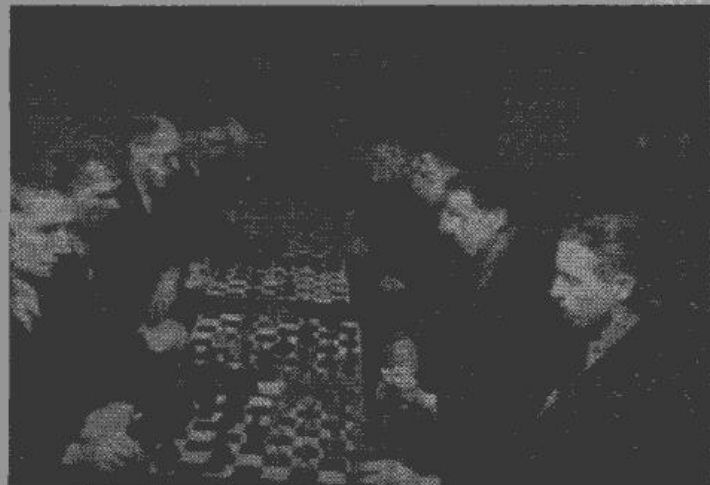
Ķēns no 2. pilsētas sacīkstēs ar Tallinnas šachā. Pa labi spēlētāji redzama Rīgas nedzirdīgo šacha vienība.