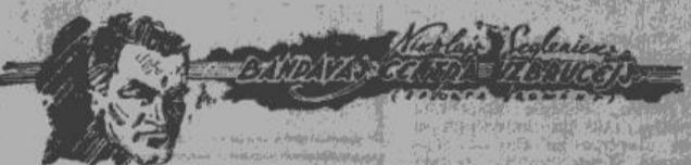
Austrumu frontē, 1942. g. augustā.