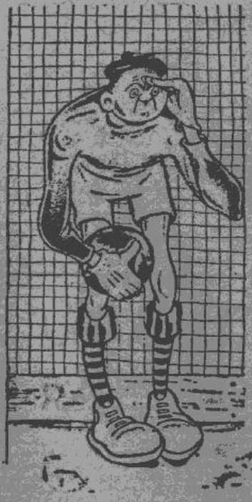
VĀRTSARGA DOMAS «Ko tie frakts tur spārdīs un plēšas, ja bumba ir pie man!»

Ungārijas meistarsacīkstēs jau kopš mēnešiem bijis skaidrs, ka jaunais meistarsacīkstēs Grosvardeins NAC. Tas nu ir pirmais gadījums, kur Ungārijas futbolā meistarsacīkstēs uzvar provinces vienība, pie kam Budapeštā nav pat izredzta ienest arī 2. vietu Pirms pēdējās kārtas: 1. NAC 47 p.