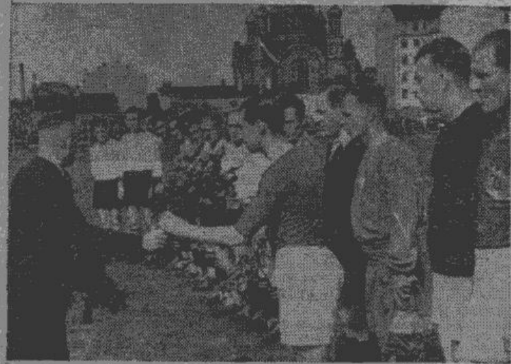
Apsveikums Rīgas futbolistiem pirms Kenigsbergas-Rīgas 5. pilsētu sacīkstes