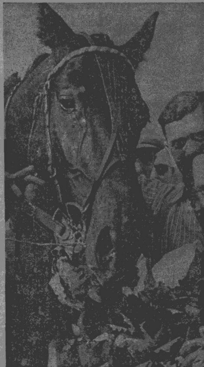
No ienaidnieka teroristu bumbām miris ne tikai nevainīgi cilvēki, bet arī bojā arī dzīvnieki. Nesas kādā terora uzbrukumā nosita Vācijas slaveno sacīkšu zirgu Hētis, kas godalgiņš savam īpašniekam bija spēlējies daudzus miljonus marķu. Uzņēmums: Hētis pēc kādas Heles uzvaras.