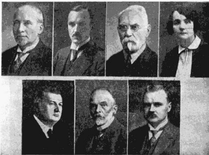
L. Ū. studējošo atturības b-bas goda filistri-mācības spēki.

Citējot Pestalocija vārdus: „Visi priecīgie un laimīgie cilvēki izstaro