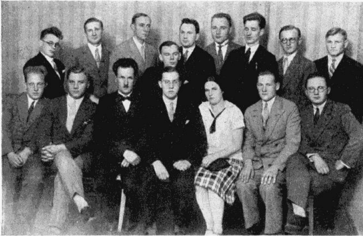
L. Ū. atturības nedēļas rīcības komitejas paplašinātā sēde 4. sept. š. g.