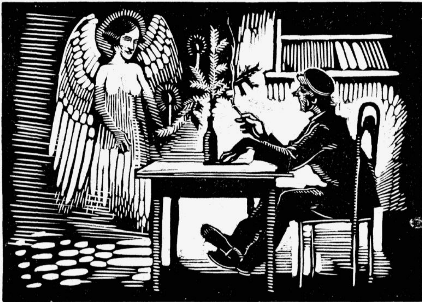
„Studentam“ zīmējis K. Krauze.

Priecīgus Ziemas svētkus novēlam lasītājiem un līdzstrādniekiem. Nāk. „Stud.“ numurs iznāks pēc Ziemas svētku brīvlaika. Red.