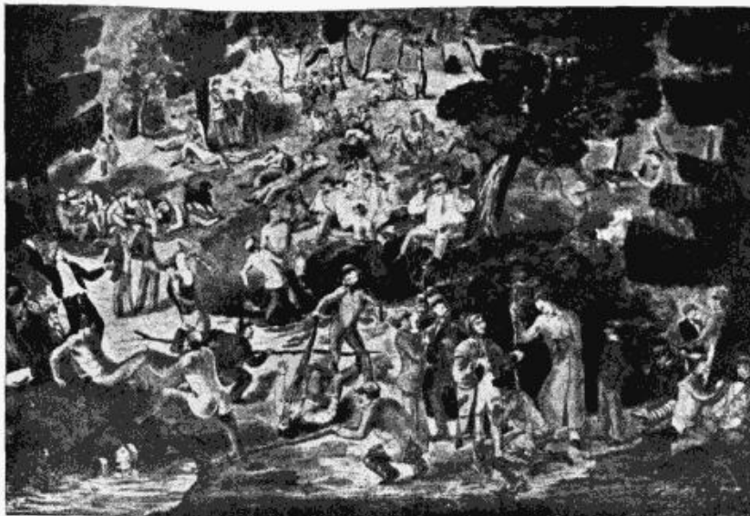
Korporāciju komerša Fraternitas Rīgensis konventgleznas fotoprodukcija.

Studentu vienotne „Latviete“ mainījusi mitekli un atrodas tagad stud. padomes namā Valdemāra ielā № 69, dz. 7.