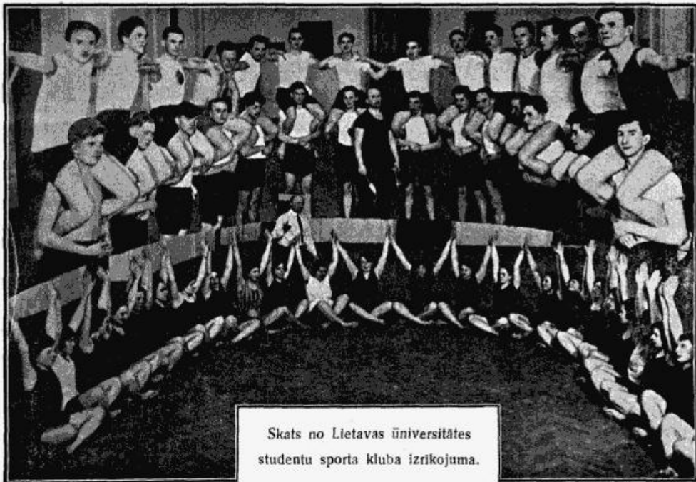
Skats no Lietavas universitātes studentu sporta kluba izrikojuma.