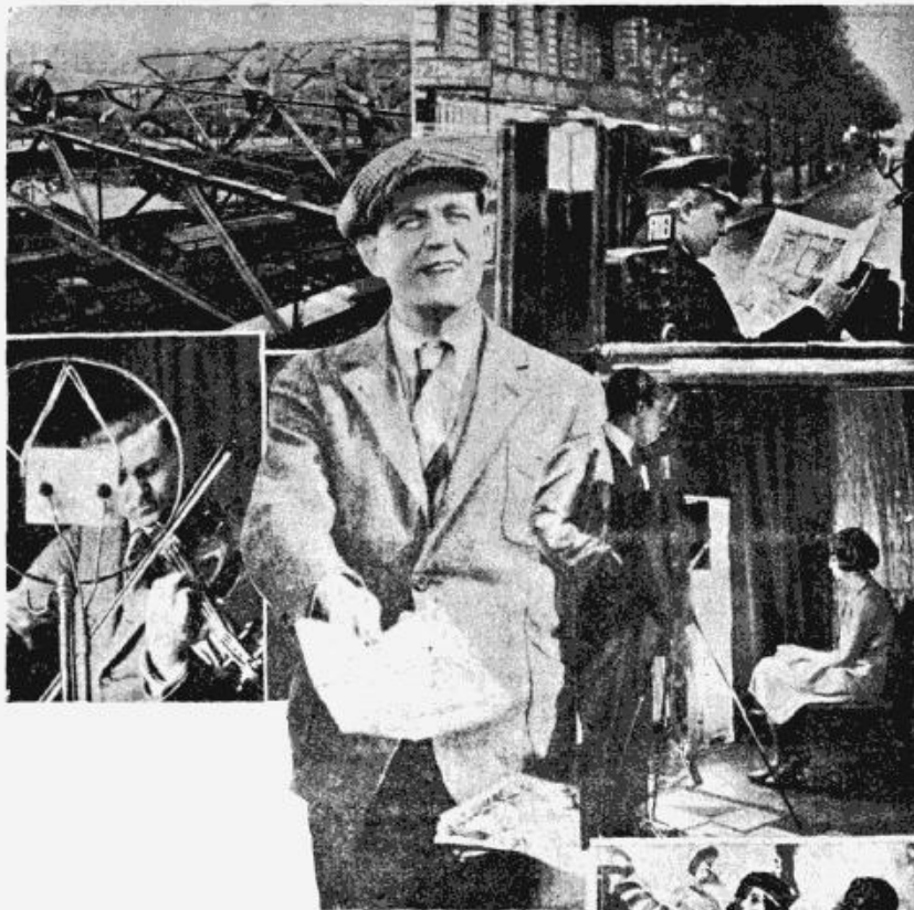
Darba studenti Berlīnē:

Varbūt kāds jautās, kādēļ Berlīnē studentus vērtē tik augstu. Pirmkārt tādēļ, ka studentiem te ir laba slava, tie ir apzinīgi un čakli, un otrkārt tādēļ, ka tie strādā par visai mazu atalgojumu. Ne par velti Berlīnes studentu starpā ir pazīstams izteiciens: „Dienā un naktī ir 24 stundas. Kam ar dienu nepietiek, tas var jemt palīgā naktī”.