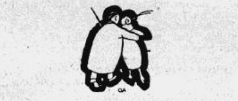
Korporēšu iespaidīgākais agitācijas līdzeklis.

L. U. Dabas zinātņu studentu b-ba pēdējā laikā sāk atjaunot atkal savu sekciju darbību, noturot sekciju sēdes, kur pārrūn un atbild uz dažādiem, iesniegtiem dabaszinātniskiem jautājumiem. Biedrība, šogad atsevišķi, 12. dec. rīko savu tradicionālo eglītes vakaru stud. virtuves telpās. Bija ievadīts no b-bas puses sarunas par kopējās eklires vakara rīkošanu ar matemātiķiem, tā savstarpēji tuvinot vienas fakultātes studējošos, bet, diemžēl, matemātiķu pulcīnā šis jautājums neatrada vajadzīgās piekrišanas.