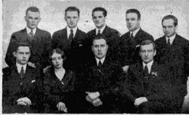
Nacionālo studentu bloks Studentu Padomē.

Kā pamatvajadzība, kas noteic arī studentu nama vispārējo planējumu ir atzīta izrikojumu zāle 1000 vai vēl vairāk personām. Ja lauku dzīvē, kā sabiedriskās dzīves materiālais priekšnoteikums, ir atzīstamas sapulcēšanās-telpas, tad mūsu metropolē vēl sevišķa liela zāle tikai stu-