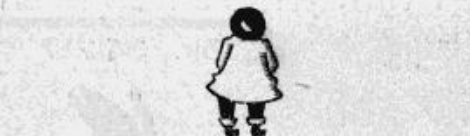
Lauku studentu pārstāvis ieradīs nobalsot par savu sarakstu.