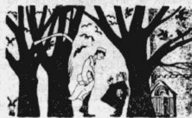
Personīgā aģitācija: — bet neaizmirsti par mani nobalsot!