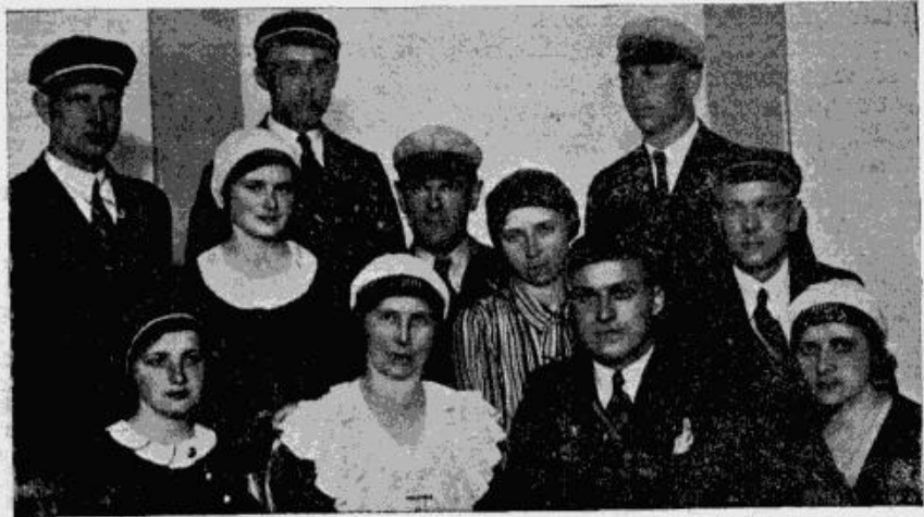
Vienotņu Vienkopas un Ateitinieku savienības prezidiu kopuzņēmums.

Jau pagājuši vairāki gadi, kad mēs latvieši iekarojam sev ne tikai valsti, bet arī tiesības nacionāli attīstīties, pēst savu pagātni, meklēt savu senču dvēselēs tos dzīvos spēkus, kas līdzējuši cauri tumšajiem gadusmēģiem uzglabāt savu nacionālo īpatnību. Augot un attīstoties, veidojot savu nacionālo kultūru, mīlot savu tēvu zemi, mums jāpazīst arī mūsu kaimiņi, mums jāmeklē draugi arī citās valstīs.