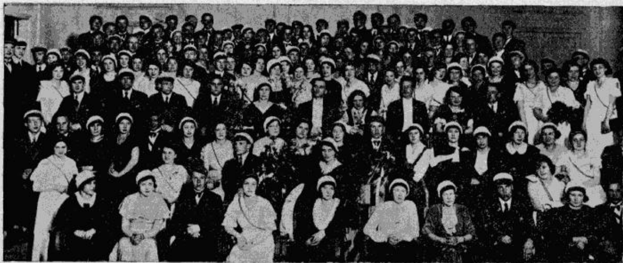
Ateitinieku koja un vienotņu locekļu kopuzņēmums.