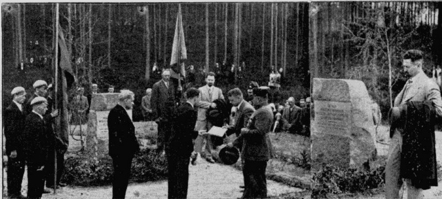
„Liduma” 9. Augstie svētki.

Gaujas attakas malā starp ģimeņu dārziņiem daudz gadus Valmieras pilcētas aizmirsta un neapkopta atradās 10 latvju zemnieku cīņītāju apglabāšanas vieta.