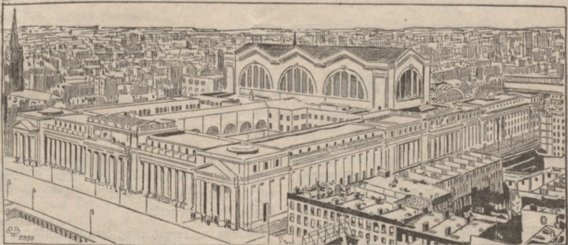
Deelata un dahrgata wofšale pašaulē.

Weenaldsigeem šateeneem wajadseja par winu slihdet, lihdsigi šalta tehrauda eefmeem us winas kermena.