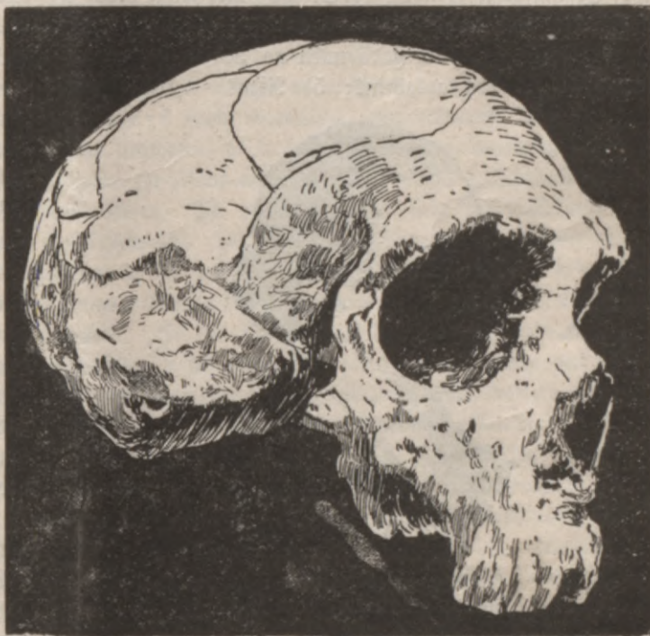
600,000 gabi wezs seeweetes galwas kauks.

Tagad kawaleeri usflatija to ar schaufmam un negribeja winas wairs pasiht. Wina bija nobehdajusēs un nolkeesejuse, taklis bija saubejis opatumu, feja kluwuse