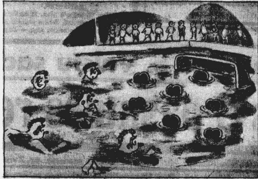
Kad ūdens polo vienība neapmierināta ar tiesneša lēmumu.

raidījumus vārtos likvidē garais igauņu vārtsargs Kepņiks, kas darbojas ar atzīstamu veiksmi. Ne sliktāks bija jaunais jelgavnieku „svētnīcas” sargs Liepkalns, tak 87. minūtē aizsardzības kļūdas dēļ, tas spīests otro reizi meklēt bumbu vārtu tīklā. Rezultāts 2-1 Pērnavas Kaleva labā, ar kādu rezultātu arī spēle noslēdzās. Vakarā pie bagātīgi un glīti klātā gada abu vienību spēlētāji draudzīgām sarunām un tautas dziesmām skanot, vēl ciešāk nostiprināja jau Jelgavā noslēgto draudzību. Šis draudzības apzīmogošanai priekšnieks R. Ramla pasniedza jelgavnieku pārstāvjiem un spēlētājiem Kaleva nozīmes.