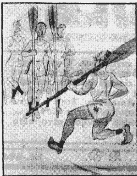
Piedodiet draugi, bet sieva mani aizmirsa laika pamodināt!