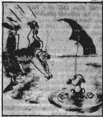
Tur, kur es ar kājām ērti sniedzu dibenu, viņš laikam domā peldēt!