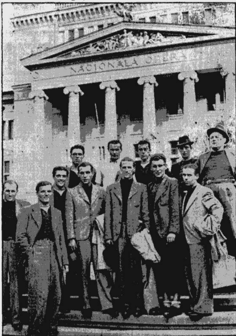
Čehu futbolisti mūsu galvas pilsētā.

ASK laukumā un šī cīņa solās izvērsties par lielu un svarīgu mūsu futbola sporta notikumu. Vakar visu dienu čehi atpūtās Rīgas Jūrmalā, izmantojot skaisto un patīkamo rudens sauli. Viesi solās cīņā Rīgā ņemt ļoti nopietni un viņu lielākā vēlēšanās ir pārspēt mūsu valsts vienību ar lielāku rezultātu nekā