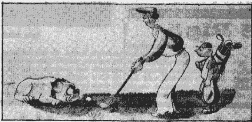
Golfa spēlētāju ienaidnieks Nr. 1.

Ja tiesnesis bija spēli pārtraucis. Bet šeit vainīgais spēlētājs pats sevi resp. savu vienību sodīja vēl bargāk, ieskaitot bumbu savos vārtos.