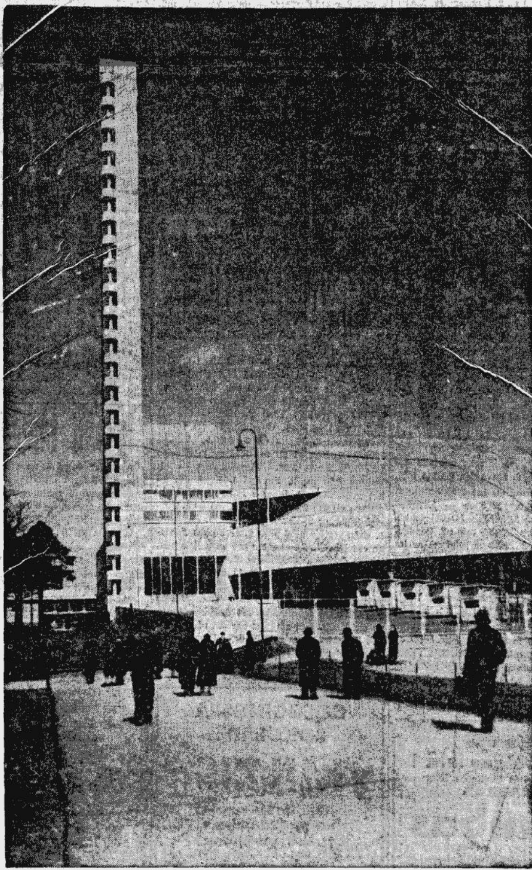
Helsinku olimpiskais stadions ar majestātisko maratona torni, kur vakar mūsu futbolisti piedzīvoja pirmo uzvaru pār Somijas izlasi viņu pašu mājās.

SĀDOS VIRKŅĒJUMOS: Latvija — Bebris; Lauks, Laumanis; Maģers, Pētersons, Lidmanis; Putniņš, Vanags, Kaņeps, Krupčāns un Borduško. Somijas vienpadsmitā ietilpa: Sarnola; Lahti, Oksanens; Asikainens, Pii, Rinne; Vekstrems, Bogomoloffs, Lehtonens, Sotiola un Beijars. Vārtērgu Sarnola 1. puslaika 25. minūtē savainoja un tad viņa vietu ieņēma rezerves spēks — Salminens. Atbildīgo tiesneša darbu veica Renke (Dānija). Sacīksti ievadīja garāka somu uzbrukumu virkne. Pēc nesen piedzīvotā katastrofālā 1-8 zaudējuma pret Dāniju šoreiz somi cīņā raidīja pilnīgi jaunu kompleksu, kas ļoti enerģiski spēlējot, jau pirmās minūtes centās atzīmēt reālus vārtu ieguvumus. Tiešām, pie Latvijas sargātiem vārtiem radās