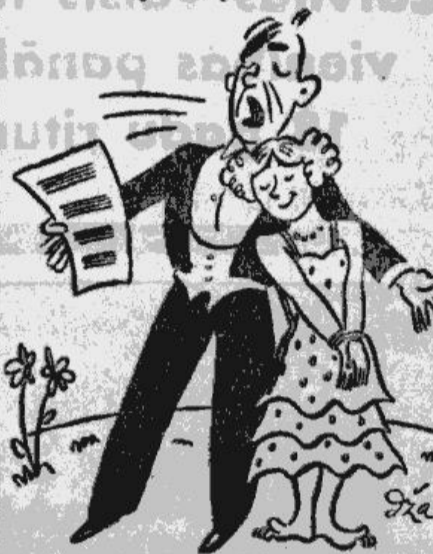
„Acite” vislabākais vorācu iznēģ nāšanas līdzeklis.