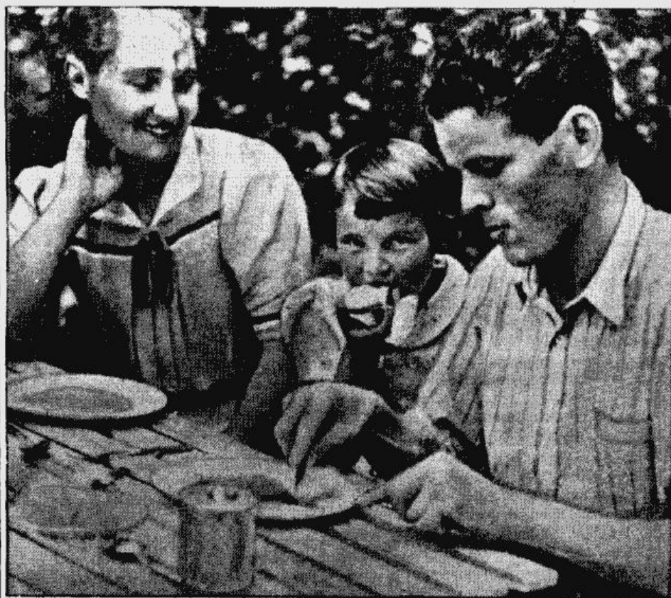
Vienkārši un mierīgi slavenais somu pasaules rekordists Taisto Meki dzīvo tīru provincē no lielpilsētas kņadas — Kerolā. Savas dzīves biedres un mazās meitaiņas vidū Meki savas mājas dārzā redzams ieturēt pusdienu maltīti.