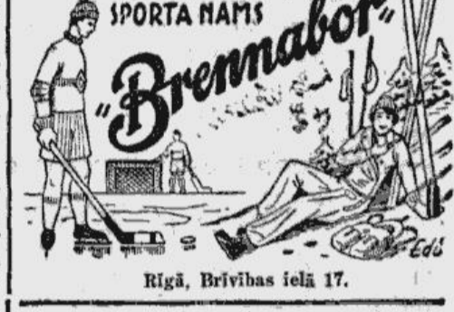
Rīgā, Brīvības ielā 17.