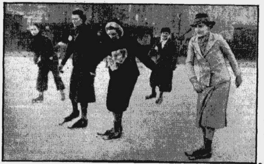
Holandē bez riteņbraukšana, iemijots sporta veids ir arī slidošana. Ar slidām brauc lielji un mazi — tas jau sen kļuvis īsta tautas sporta. Attēlā redzam, ka iemijoto slido sportu piekopj arī nākošā Holandes karaljene — tropantniece Juliana. Arī mums holandiešu slidskrējēji ir pazīstami, jo tos redzējam pagājušā gadā EM Rīgā. Vēlreiz slidošanas apstākļi tiešām ideāli, jo ziemā satiksmes ceļi ir daudz Holandes kanāli, kuri ziemā pārkļūst ar ledus kārtu, tādā veidā veidojot garākos ledus ceļus pasaulē.