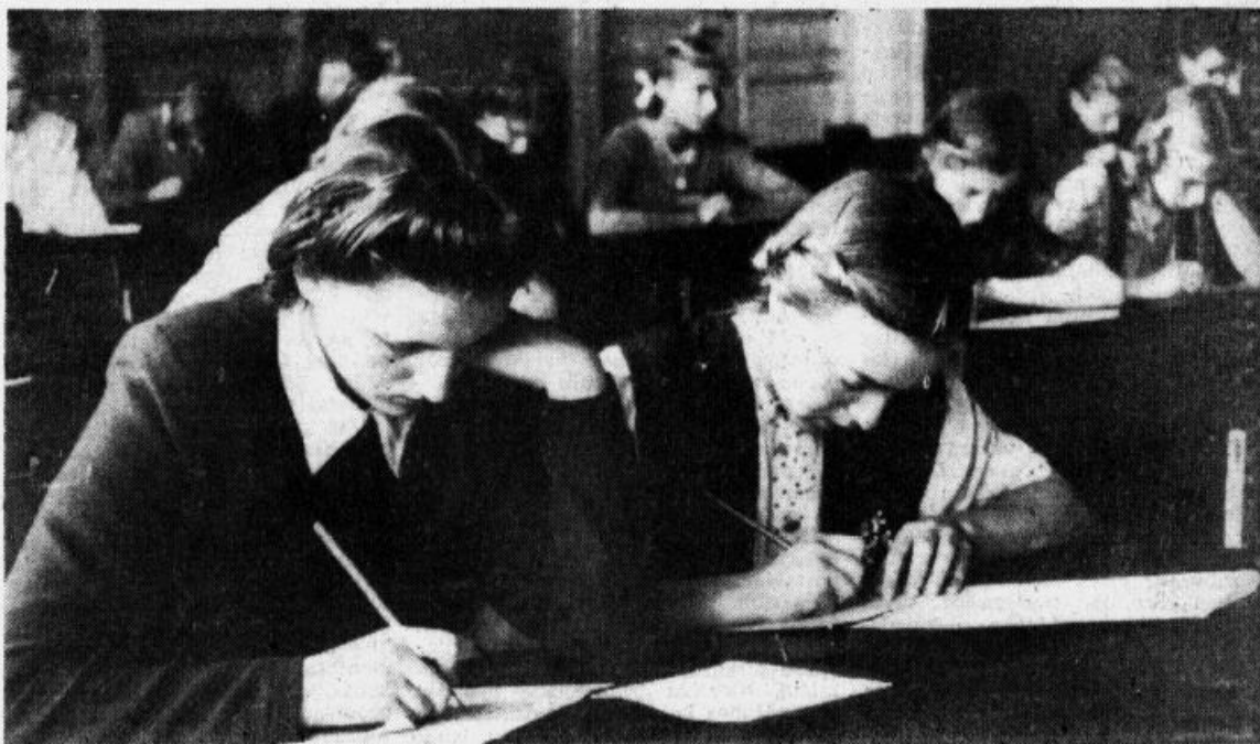
Uzņēmumā: Pārbaudījums matemātikā Rīgas pilsētas 1. septiņgadīgās skolas septītajā klasē.

PADOMJU LATVIJAS SKOLĀS SĀKUSIES EKSAMENI