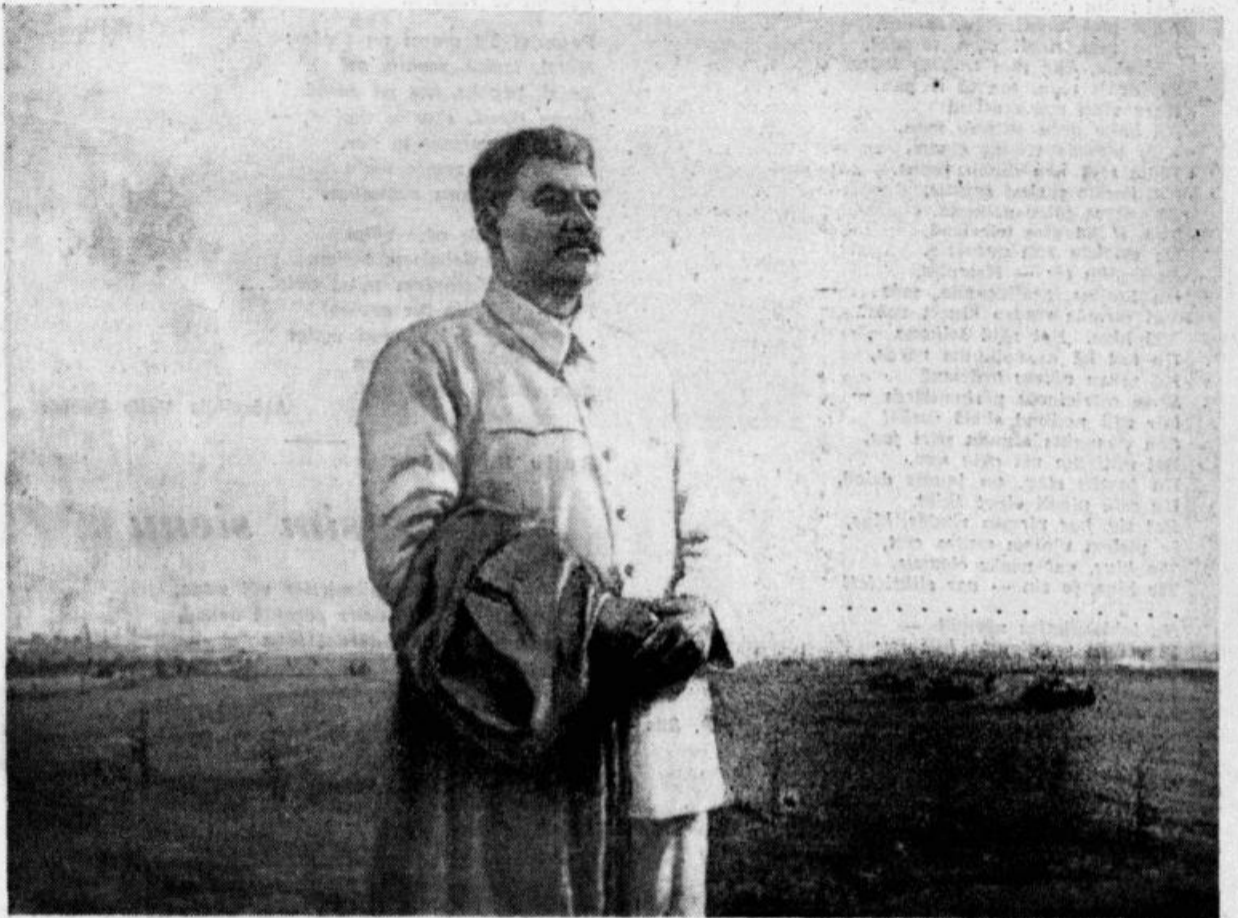
Mūsu Dzimtenes rīts