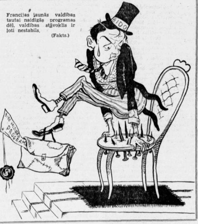
Bido jaunās valdības stāvoklis

«Literatūras un Mākslas» nākamais numurs iznāks pirmdien, 7. novembrī.