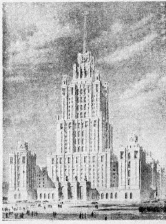
26 stāvu viesnīcas ēkas projekts. Autors — PSRS Arhitektūras akadēmijas īstenie loceklis A. Mordvinovs