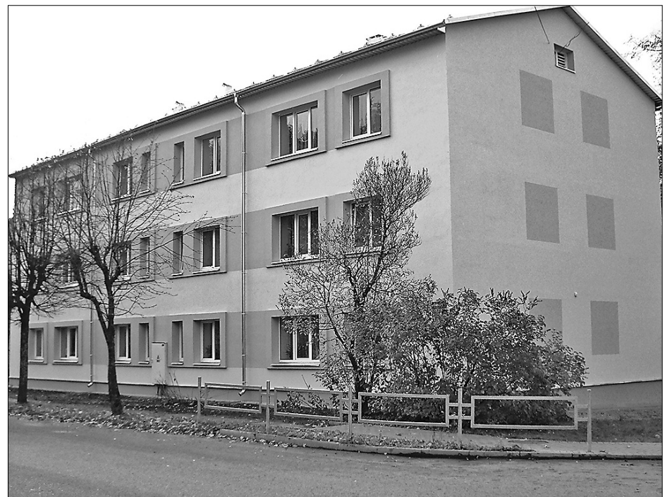
un pēc renovācijas

Valsts atbalsts paredzēts daudzdzīvokļu mājām, kurās ir vismaz 5 dzīvokļi un vienam īpašniekam pieder mazāk nekā 20%