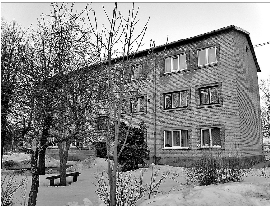
Daudzdzīvokļu ēka pirms

Lielākā daļa Latvijas iedzīvotāju šodien dzīvo pirms vairākiem gadu desmitiem būvētās daudzstāvu mājās. Daudzu gadu laikā šo ēku tehniskais stāvoklis ir būtiski pasliktinājies – fiziski nolietojušās konstrukcijas, inženiersistēmas. Liels skaits ēku ir avārijas stāvoklī, ziemā mājokļi ir vēsi un mitri, vasarās pārāk karsti. Iedzīvotājiem palielinās apsaimniekošanas izdevumi, maksa par apkuri, jāveido uzkrājumi avārijas remontiem.